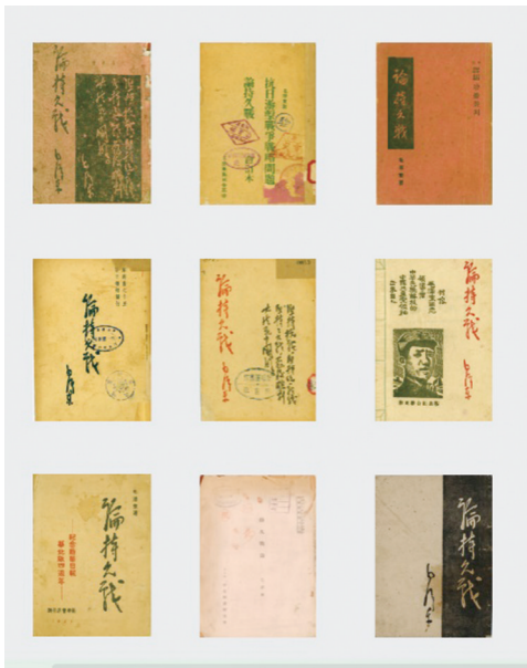
《论持久战》多个版本