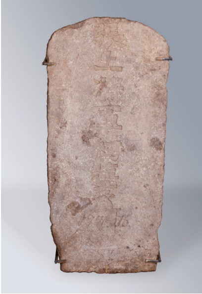
张自忠初葬处的石碑

Comment 从1938年11月至1939年2月分别连载；其日文版也于1938年12月由上海中支经济研究所翻译并全文发表。